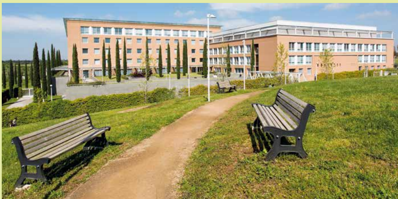
In questa pagina una veduta del Centro SM del Policlinico Universitario Campus Bio-Medico di Roma, nella pagina a fianco l'ingresso del Policlinico Universitario e un particolare dell'interno.

ti che si rivolgono a noi. Partendo dall'ascolto delle necessità e dei bisogni di ciascuno, lavoriamo per creare un clima di fiducia e stima reciproca, che è essenziale per aiutare le persone con SM ad affrontare le difficoltà e le sfide che la malattia quotidianamente mette davanti. Il Centro è coordinato dal sottoscritto, coadiuvato dagli specializzandi e i dottorandi che lavorano presso la UOC di Neu-